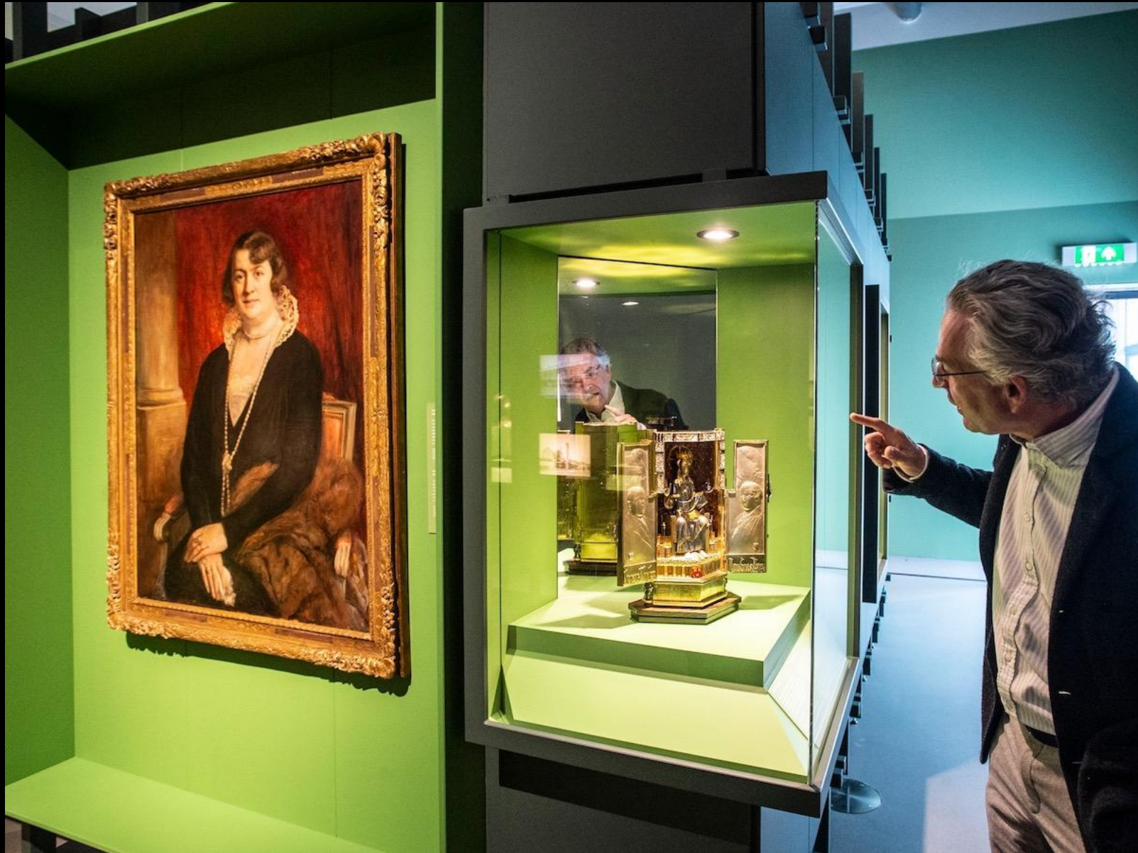
Stedelijk Museum Breda