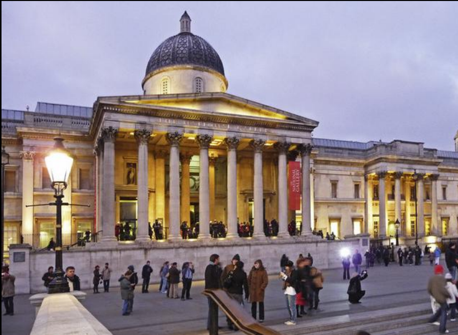
Museum Londen, The National Gallery