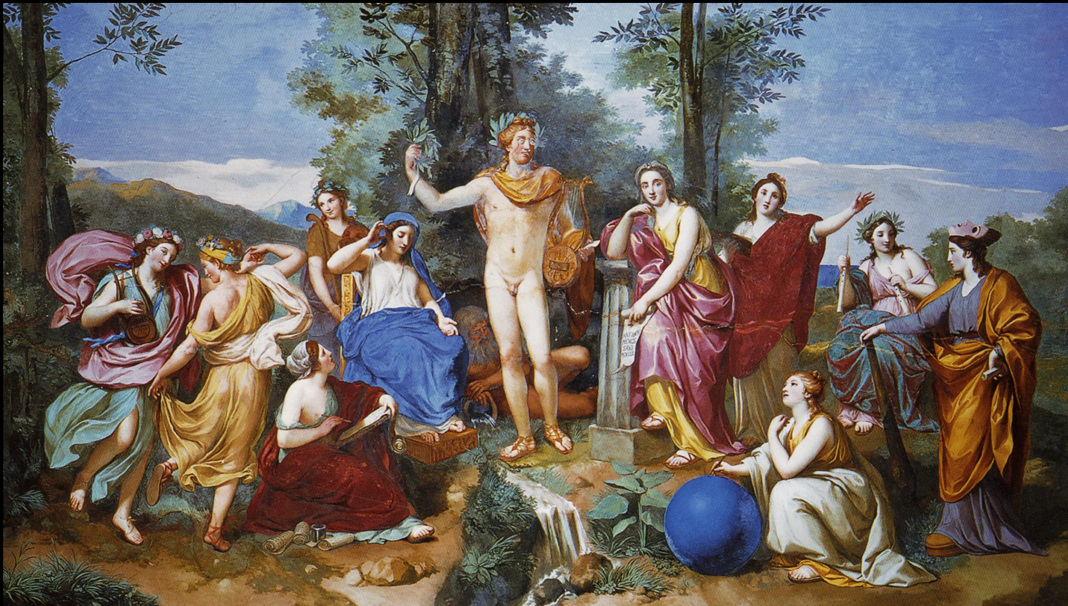
Anton Raphael Mengs, Apollo, Mnemosyne, and the Nine Muses (1761)