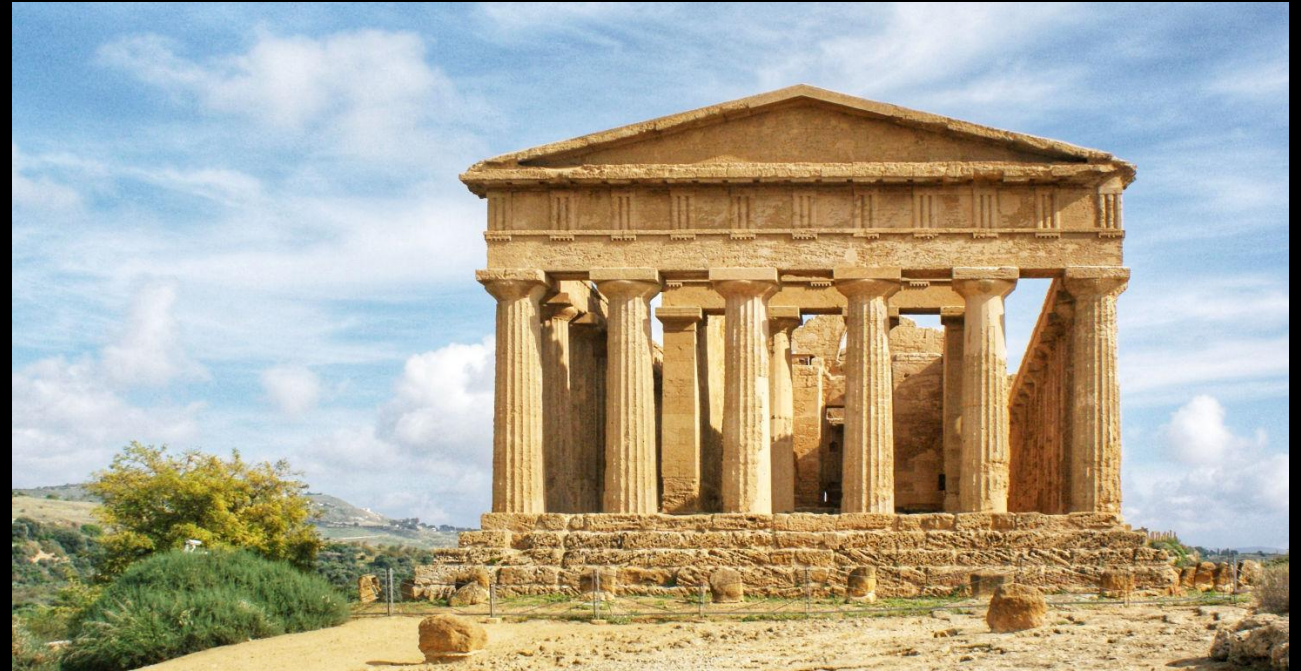
Tempelvallei van Argigrento